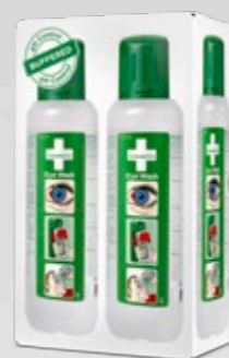
CEDERROTH ÖGONDUSCH REF 725200

Självhäftande skylthållare i plast för montering som flaggskylt.