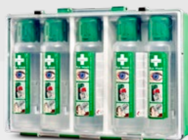
CEDERROTH ÖGONDUSCHVÄSKA REF 7255

2 st (x 500 ml) steril buffrad isoton saltlösning utan konserveringsmedel för engångsbruk. Flaskans mått: 6,5 cm x 23,5 cm. Hållbarhetstid 4,5 år.