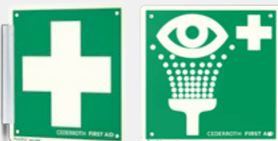
SKYLT FÖRSTA HJÄLPEN-KORS REF 1738

Dubbelsidig och efterlysande. 20 x 20 cm.