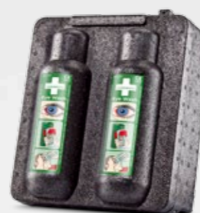
CEDERROTH VÄRMESKÅP REF 790400

Värmeskåpet är avsett för förvaring av två flaskor Cederroth Ögondusch i kalla miljöer. Skåpet håller ögonduschväskaans temperatur på +20°C vid omgivande temperatur ned till -20°C. Det fungerar automatiskt vid både 12V och 24V utan ytterligare tillbehör (med transformator även vid 230 V). Stickpropp för cigarettändaruttag i bilar och lastbilar. Spännings-vakt. Elsäkerhetstest och CE-märkt. Ögondusch beställs separat (REF 725200).