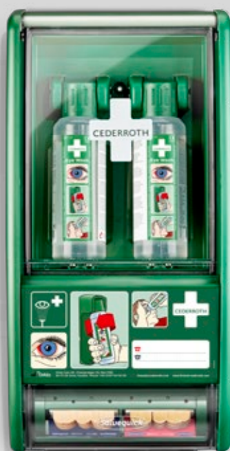
CEDERROTH ÖGONDUSCHSTATION REF 721500

Innehåller: 2 Cederroth Ögonduschflaskor à 500 ml (REF 725200) 1 Salvequick Plåsterautomat inkl. 45 Salvequick Plastplåster (REF 6036) 40 Salvequick Textilplåster (REF 6444) 1 Ögondusch-instruktion 1 Refillnyckel