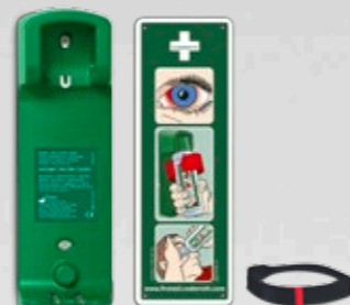
CEDERROTH VÄGGHÅLLARE REF 7200

Hölster i grön nylon med bälteshälla till Cederroth Ögondusch i fickmodell (REF 7221). Mått: B 8 x H 16 x D 4,5 cm.