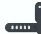
Rekola Addon HOOKIT

Waterproof and convenient Vattentät, kan enkelt och hygieniskt sköljas efter användning 14-9000019