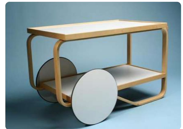
Tevagn av Alvar Aalto