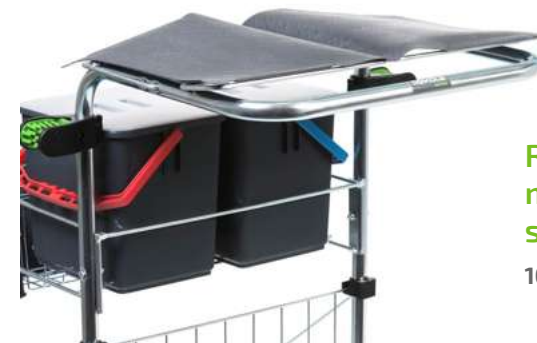
Rekola Addon EVA magnetiskt lock för sopsäck

Anpassningsbar krok för alla verktyg med handtag, lämplig från Ø 10 mm upp till Ø 32 mm, passar alla former – rund, oval eller rektangulär. Bär en dynamisk vikt på upp till 1,5 kg. 17-900161