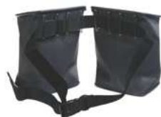
Rekola Addon BÄLTE

Även idealisk för bioavfall eller för transport av toalettpapper. 10-90031