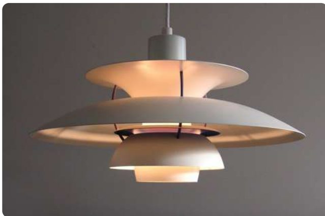
PH 5 hängande lampa av Poul Henningsen