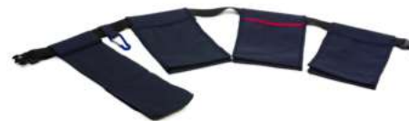
Rekola Addon WORK ARBETSBÄLTE med tygpåsar

Anpassningsbart arbetsbälte för ett optimalt arbetsflöde. 10-90013 blue