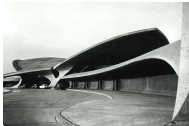
JFK-flygplatsen av Eero Saarinen