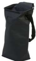
Rekola Addon EVA MOPPVÄSKA, vattentät

Även idealisk för bioavfall eller för transport av toalettpapper. 10-90031