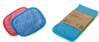
HÖGPRESTERANDE STÄDDUKAR OCH PADS