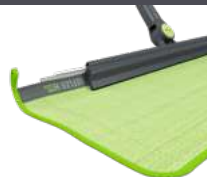
MOPP M. HÖGT YTTRYCK