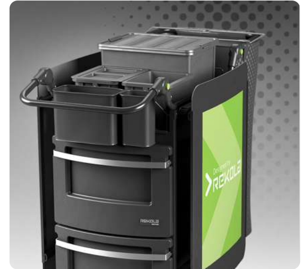
Rekola Motion Städvagn

Våra vagnar är av stål och det finns en bra anledning till detta: vad vi än gör är hygienen alltid högsta prioritet. Våra vagnar av stål är enkla att hålla rent, vilket är mycket viktigt för hygienisk städning. Alla våra vagnar är designade för städklara och förimpregnerade metoder, som vi anser är mer hygienisk än andra metoder. Vi kan också tillverka mindre antal av skräddarsydda vagnar för särskilda projekt.